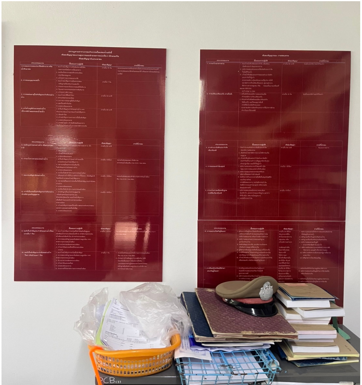
รูปภาพผลการดำเนินงานจริง ณ จุดบริการ ของสถานีตำรวจ