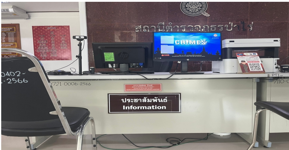
รูปภาพผลการดำเนินงานจริง ณ จุดบริการ ของสถานีตำรวจ