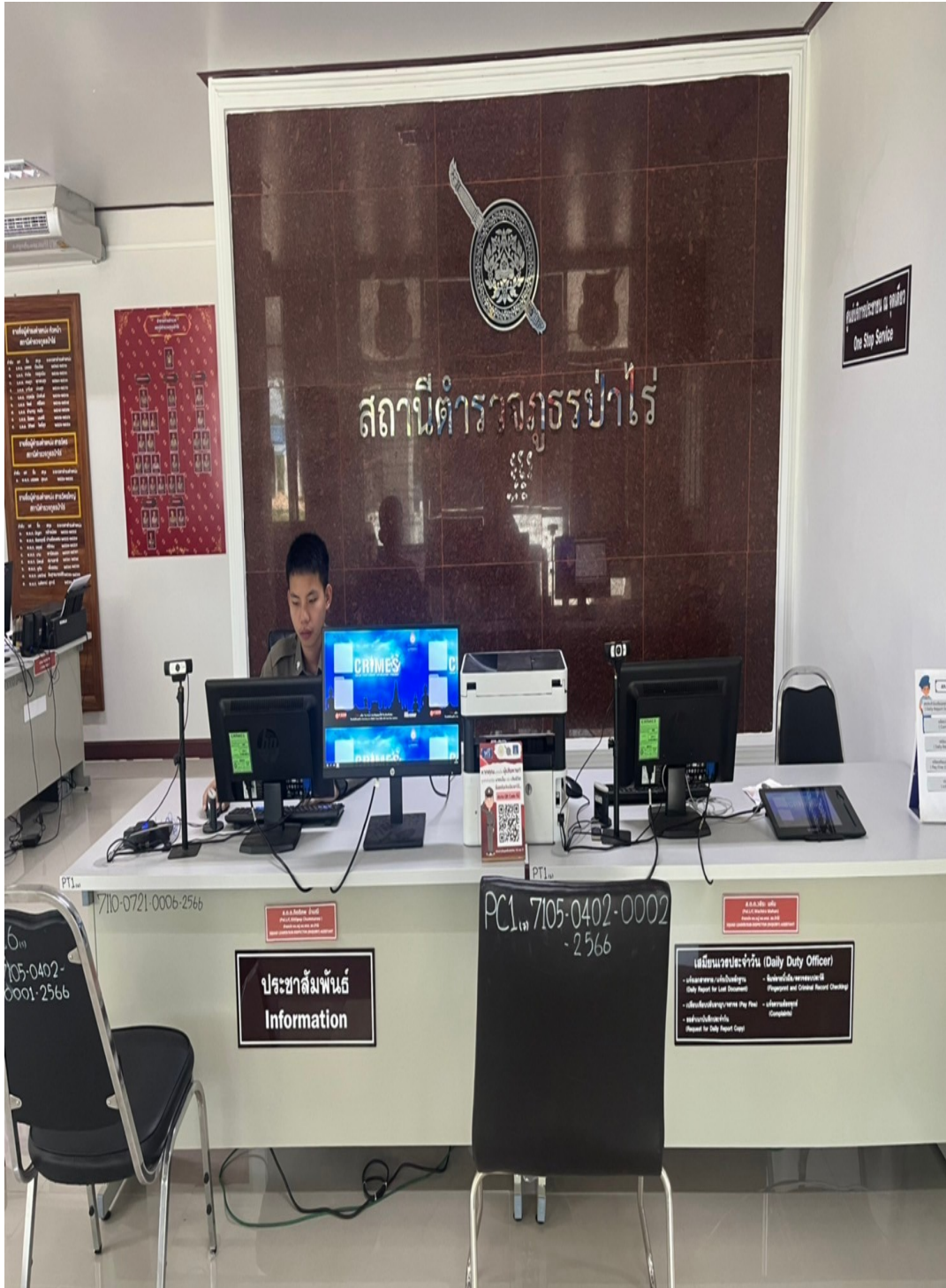
รูปภาพผลการดำเนินงานจริง ณ จุดบริการ ของสถานีตำรวจ