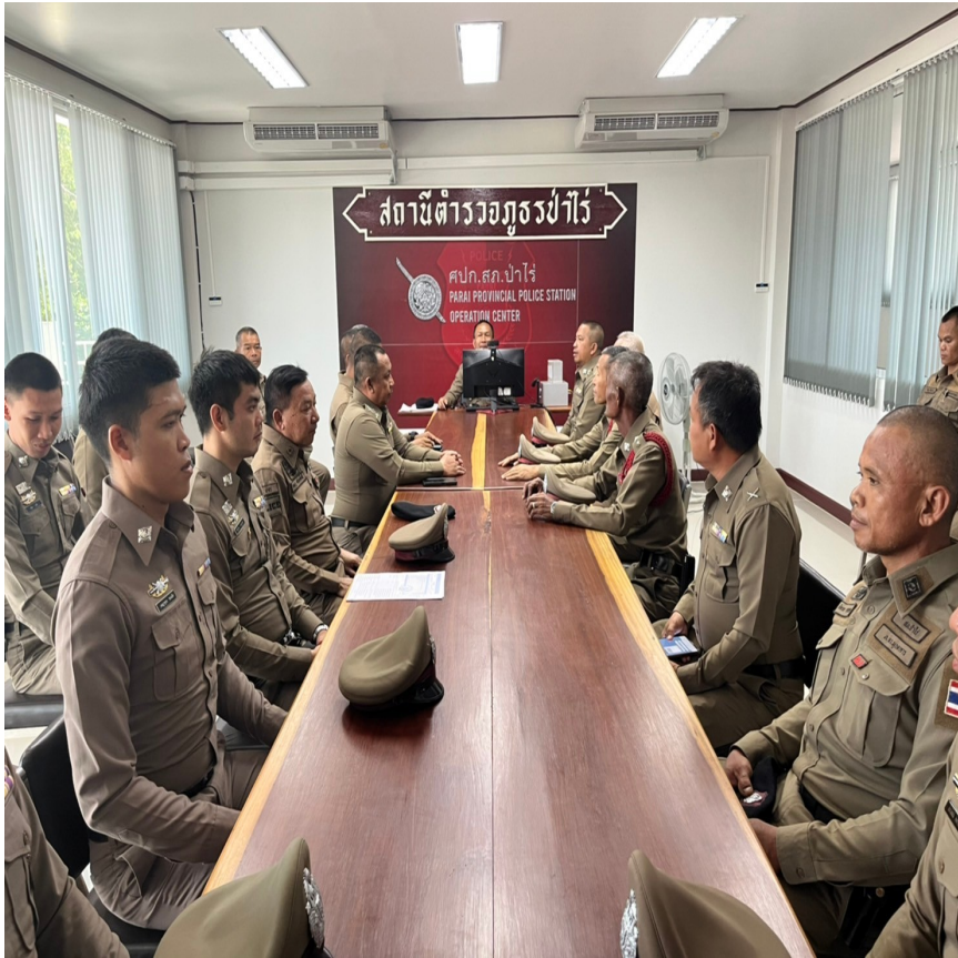
รูปภาพผลการดำเนินงานจริง ของสถานีตำรวจ